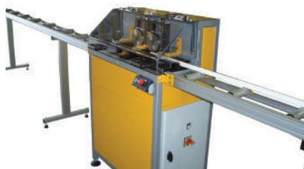
Sertisseuse de profils