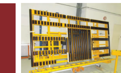
Table de pose de vitrage