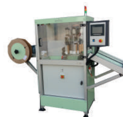
Machine de coupe de joint - onglet