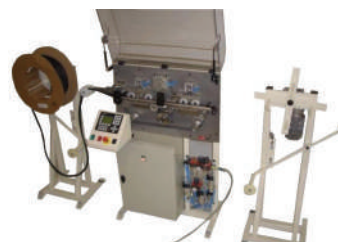
Machine de prédécoupe et coupe joint