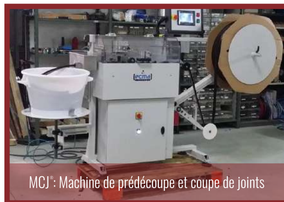
MCJ : Machine de prédécoupe et coupe de joints

We offer a set of solutions to optimize the technical and economic performance of your joinery, allowing you to focus your attention on your product offer and on regulatory changes in the market (BBC, RE2020, etc., ...).